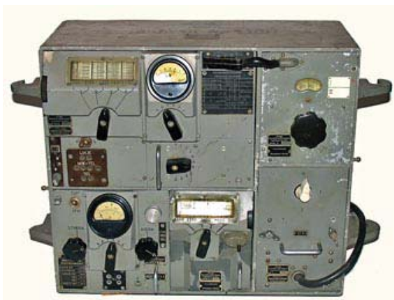
25 W mobil m/39