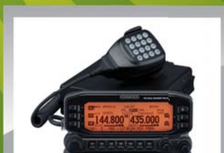
Kenwood TM-710E 144/430Mhz med APRS 4995 KR

Annonsperiod: 31/12 - 2013 eller så långt lagret räcker