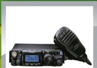
Yaesu FT-817ND QRP HF/50/144/430Mhz 5995 KR