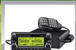
Icom IC-E2820 144/430Mhz inkl UT-123 D-star 6995 KR