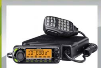
Icom ID-E880 144/430Mhz med D-star 3995 KR