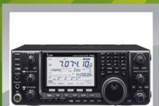
Icom IC-7410 HF/50Mhz 100w 14 495 KR