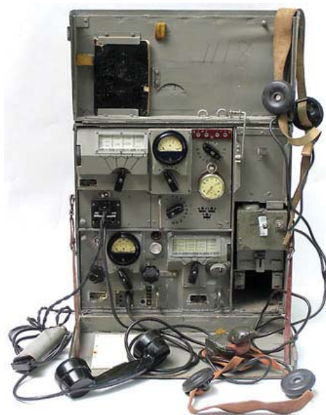
10 W portabel m/39

Uteffekten var 5-7 W och frekvensområdet 2.5 - 5 MHz i 4 segment. Radion drevs med 4.8V NiFe accumulator och levererades med bl.a en hopfällbar handgenerator.