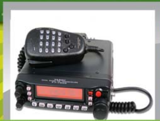
Yaesu FT-7900 144/430Mhz 50/45W 2795 KR